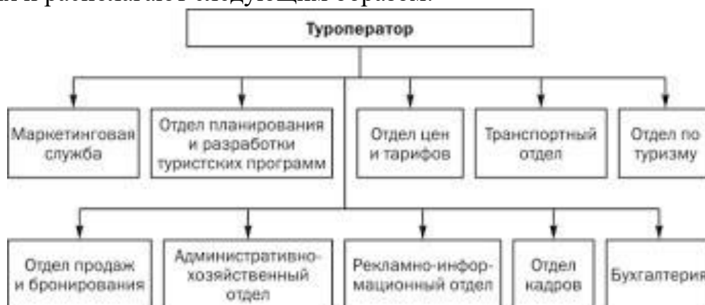
Рисунок 2 – Структура управления

Слово «Рисунок» и наименование помещают после пояснительных данных и располагают следующим образом: